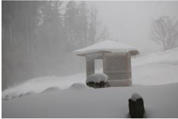
①森山森林公園の東屋