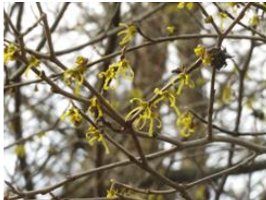
⑤登山道のマンサクの花