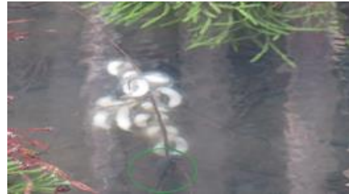
⑦クロサンショウウオの卵と親